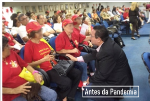
Antes da Pandemia